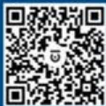
国家反诈中心 百家号