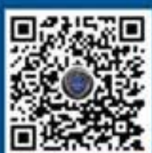
国家反诈中心 微信视频号