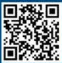
国家反诈中心 人民号