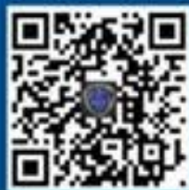
国家反诈中心 企鹅号