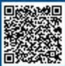
国家反诈中心 快手号