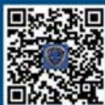
国家反诈中心 APP ios 下载