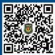
公安部刑侦局 微信视频号