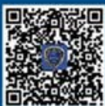
国家反诈中心 APP Android 下载