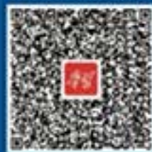
国家反诈中心 强国号